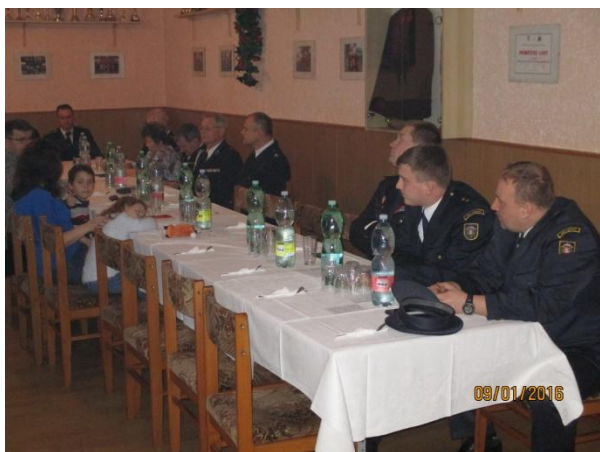
kolegové ze Závady