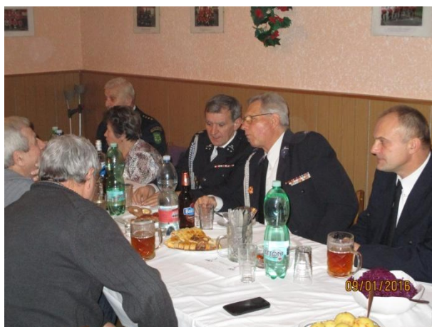
kolegové z OSP Marklowice Górne